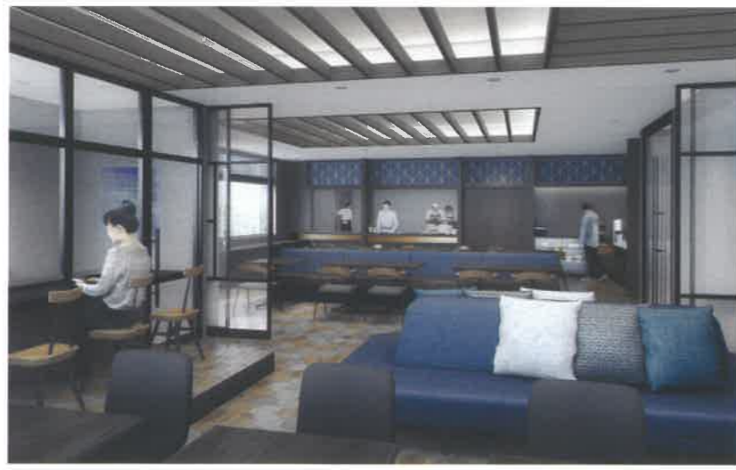
※写真はすべてイメージです。

2021年4月新築オープン! 平尾駅まで徒歩約3分!! 天神(西鉄電車約5分)への近さが魅力!